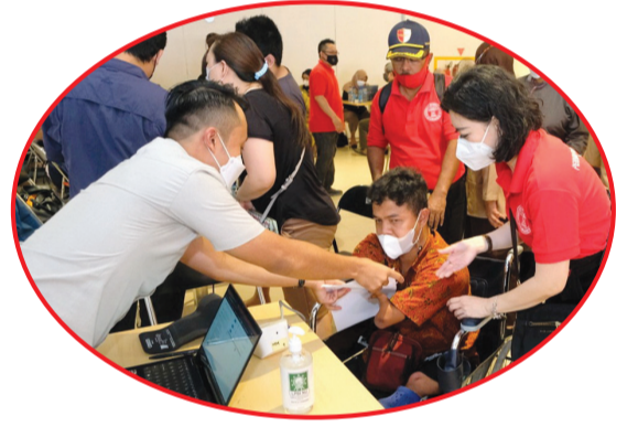
Suasana pelaksanaan vaksinasi yang menerapkan protokol kesehatan.

CIMAH (IM) - Pengurus Cabang Perhimpunan INTI (Indonesia Tionghoa) Cimahi bersama Dinas Kesehatan Kota Cimahi dan Transmart, Kamis (14/10) lalu menyelenggarakan vaksinasi Covid-19, di Transmart Cimahi, Jawa Barat.