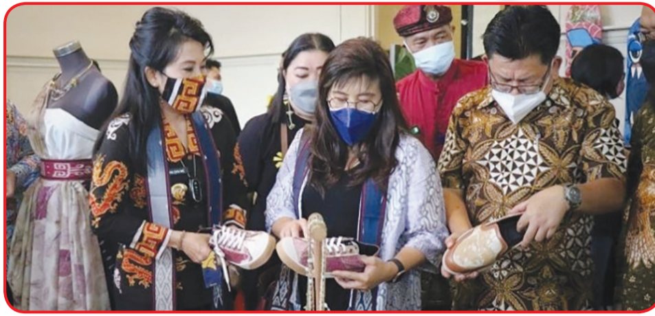
Wali Kota Singkawang Tjhai Chui Mie mengunjungi Pameran Produk Ekonomi Kreatif bertajuk “ODE” di SCH Gedung Mess Daerah Singkawang.

“Semoga ekonomi kreatif di Kota Singkawang maju dan berkembang. Sehingga produk unggulan yang di-